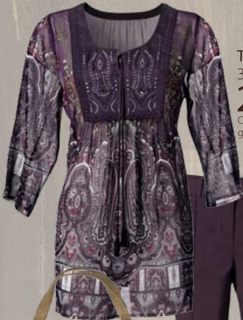
Tuniek 38-52 24.99 Ook verkrijgbaar in groen en blauw