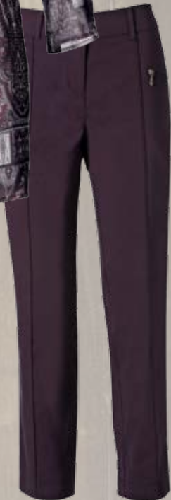
Broek 38-54 24.99 Ook verkrijgbaar in bruin en grijs