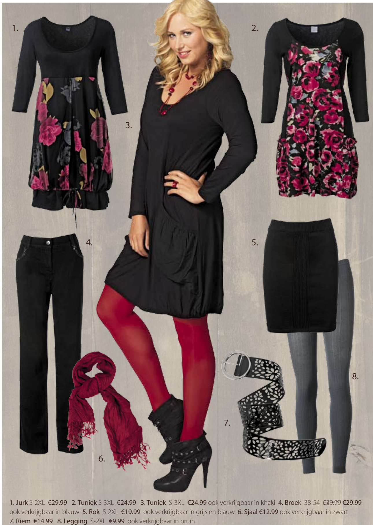
1. Jurk S-2XL €29.99 2. Tuniek S-3XL €24.99 3. Tuniek S-3XL €24.99 ook verkrijgbaar in khaki 4. Broek 38-54 €39.99 €29.99 ook verkrijgbaar in blauw 5. Rok S-2XL €19.99 ook verkrijgbaar in grijs en blauw 6. Sjaal €12.99 ook verkrijgbaar in zwart 7. Riem €14.99 8. Legging S-2XL €9.99 ook verkrijgbaar in bruin