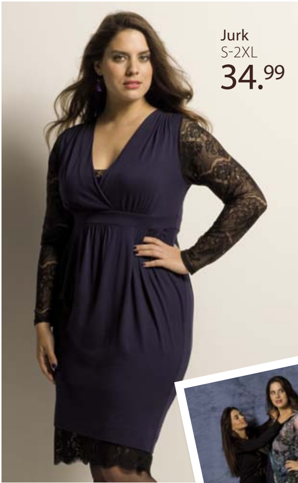
Jurk S-2XL 34.99