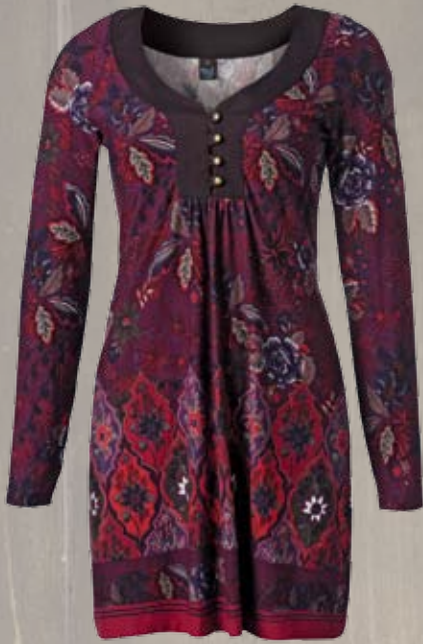
Tuniek S-3XL 24.99