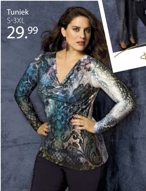
Tuniek S-3XL 29.99