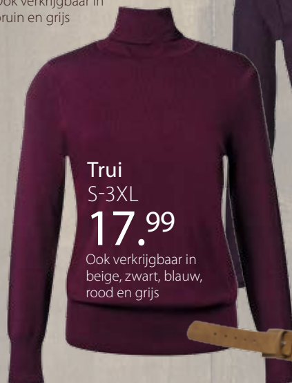
Trui S-3XL 17.99

Ook verkrijgbaar in beige, zwart, blauw, rood en grijs