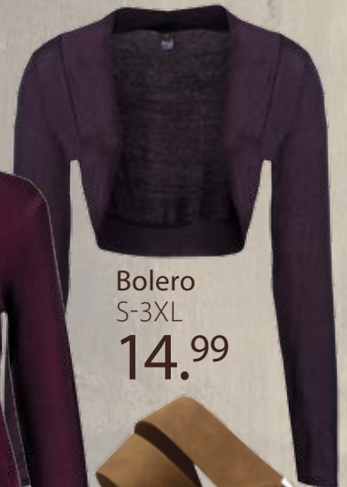
Bolero S-3XL 14.99

Ook verkrijgbaar in beige, zwart, blauw, rood en grijs